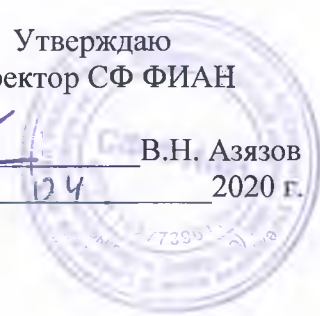
ГРАФИК дежурств по СФ ФИАН в нерабочие дни с 13 апреля 2020г. по 17 апреля 2020г.